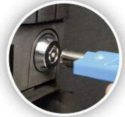
Bloqueos interiores de acceso al efectivo (opcionales)