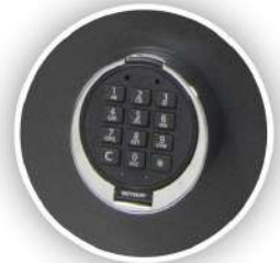
Cierre de seguridad electrónico con apertura retardada (opcional)